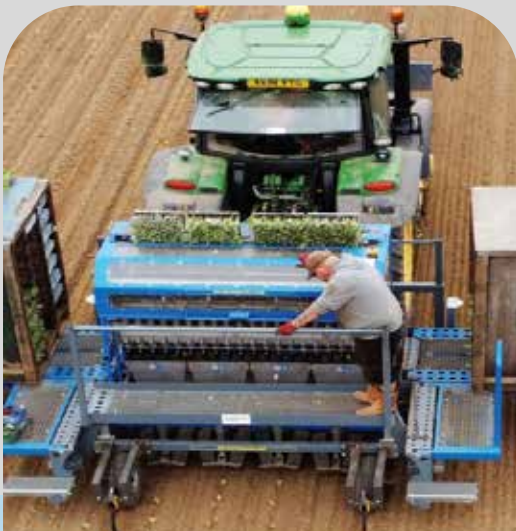
Fyra rader, 20 000 plantor per timme