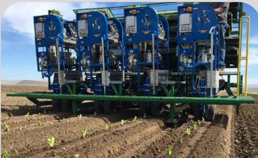
Text image: Fyra rader, 20 000 plantor per timme