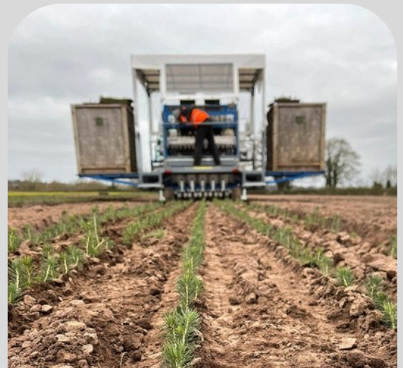
Plantering av skogsplantor, fem rader, en robot